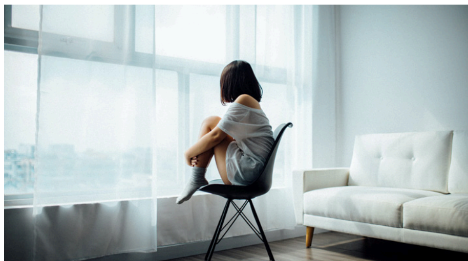
I pazienti giovani sono in aumento